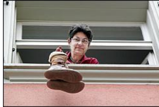
Mit den Schuhen wollten die Lesben Präsenz markieren.

Gestern liessen die Berner Lesben ihre Schuhe aus dem Fenster baumeln. Anlass war der International Shoe Day, ausgerufen vom weltweit führenden Lesben-Online-Netzwerk Shoe. Die Lesben wollten damit Präsenz markieren und sich besser vernetzen.